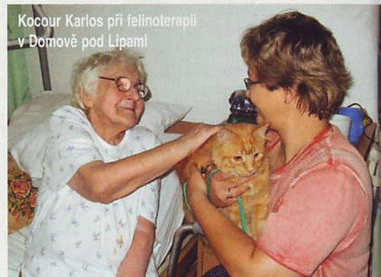
Kocour Karlos při felinoterapii v Domově pod Lipami