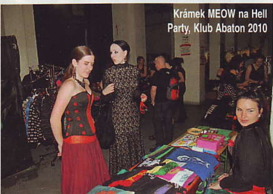
Krámeček MEOW na Hell Party, Klub Abaton 2010