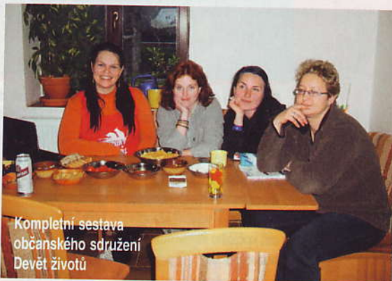
Kompletní sestava občanského sdružení Devět životů