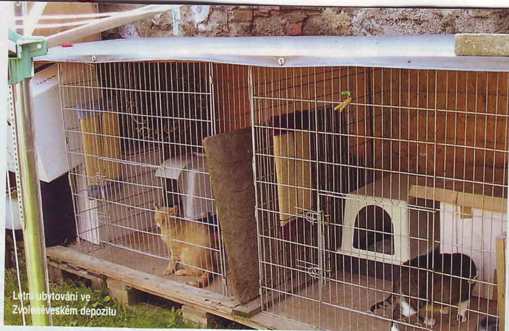
Létní ubytování ve Zvoleněveském depozitu

péči o neustále přibývající počet koťat," uvádí sdružení ve své výroční zprávě za rok 2010.