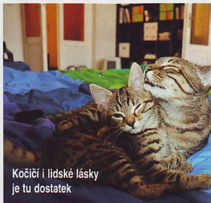
Kočičí i lidské lásky je tu dostatek